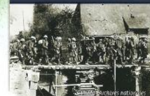
Soldats de la 27 ème Division empruntant un pont provisoire à Saint-Souplet, 19 octobre 1918.