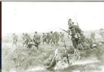
Des soldats de la 1ère Division marchent sur Cantigny, 28 mai 1918.